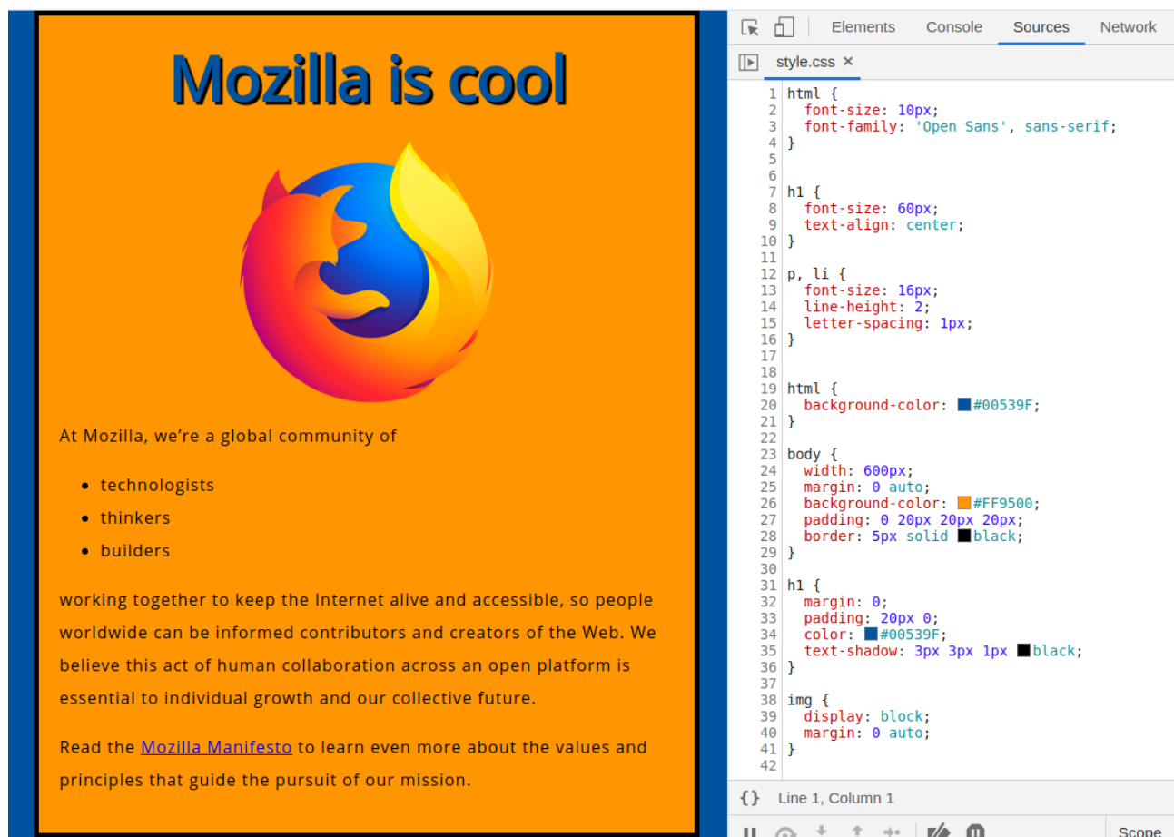
Figure 2: html et css

Souhaite-t-on aligner horizontalement, verticalement, avoir une image positionnée précisément ou à une position dépendant des dimensions de la page ?