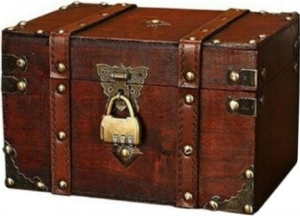
Figure 2: Coffre