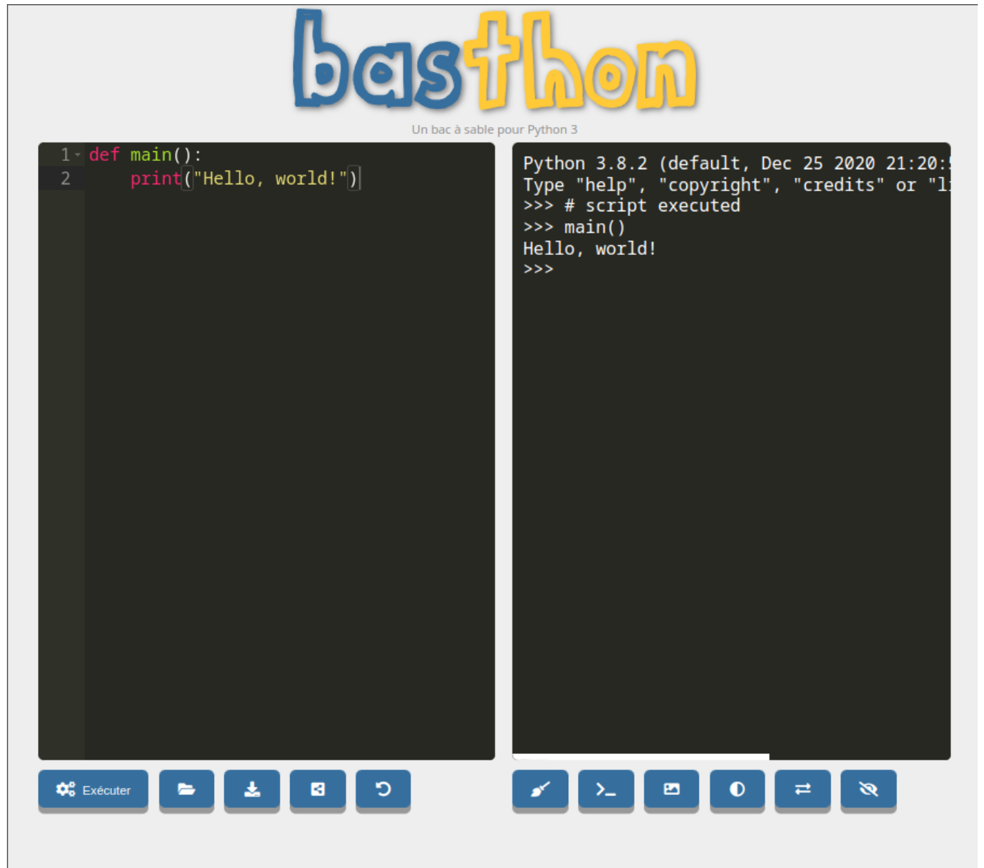
Figure 3: img

Dans l'éditeur (à gauche) on a créé une fonction puis exécuté le script.