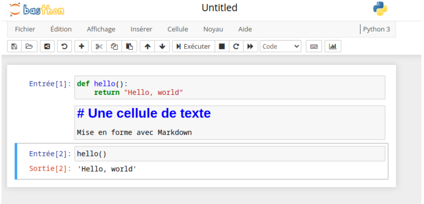
Figure 4: img