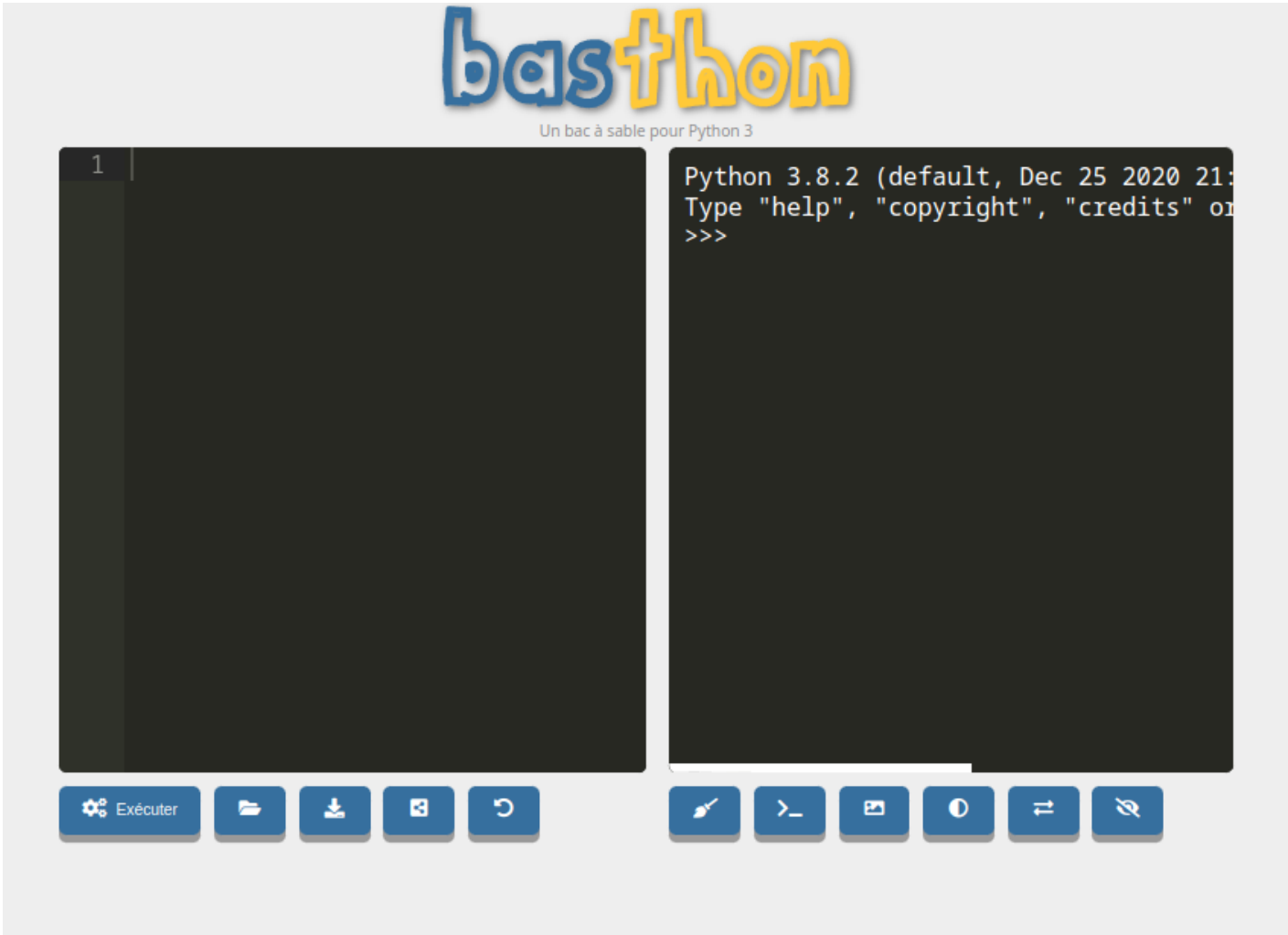
Figure 2: img