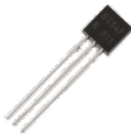
Figure 1: transistor

C'est un interrupteur contrôlable. Il dispose de 3 broches (2 entrées, 1 sortie.)