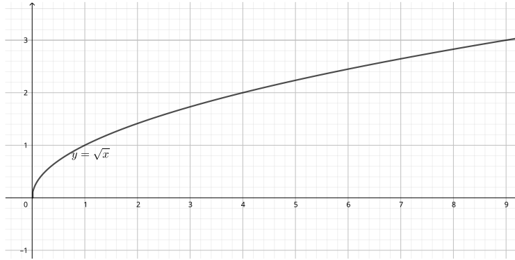
Figure 2: Racine carré